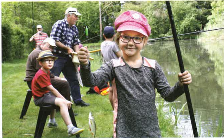
P'tites randos : partie de pêche à la Bardière.

nature à Maulny, partie de pêche à la Bardière, repas à la cantine et dodo dans les sacs de couchage au gymnase et à la Maison des associations. C'est un énorme investissement de la commune, des associations et des bénévoles qui rendent possible cette belle opération.