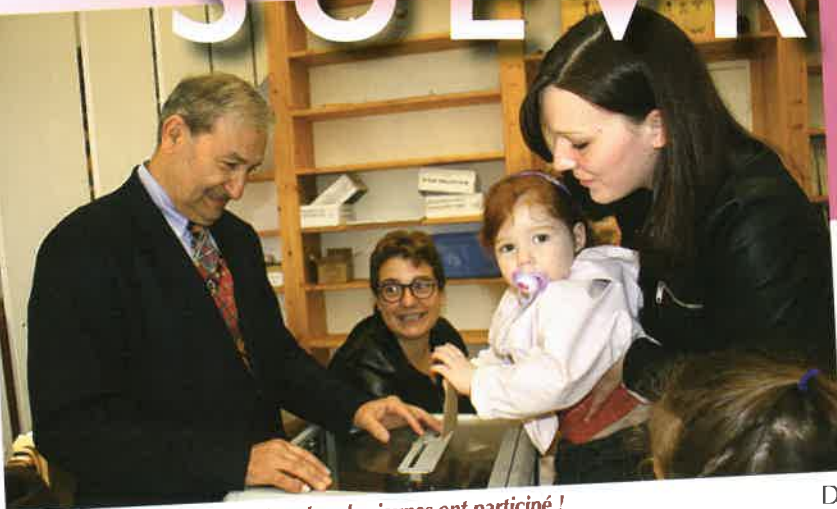
Bureau de vote le 7 mai : même les plus jeunes ont participé !