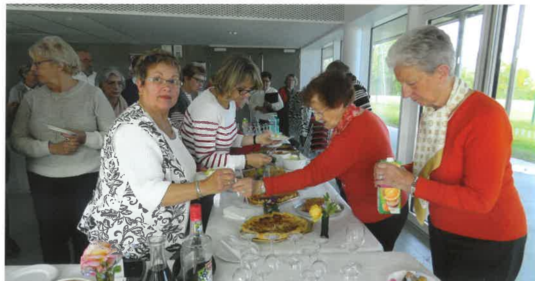
Moment de convivialité à Mesquer en mai dernier.

La chorale chante a capella ou accompagnée pour certains morceaux par