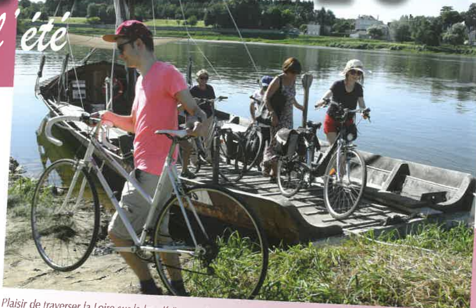
Plaisir de traverser la Loire sur le bac Kairos et de revenir par l'autre rive avec les vélos.