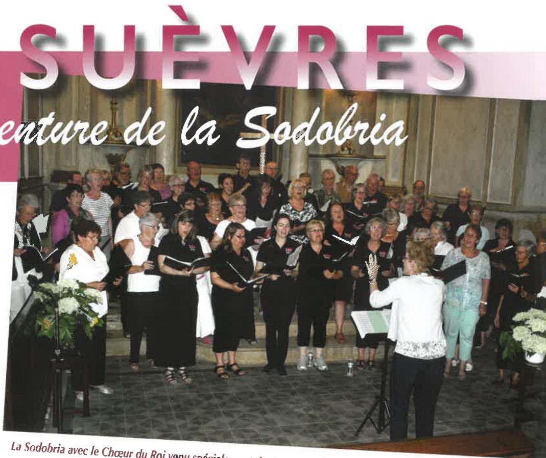
La Sodobria avec le Chœur du Roi venu spécialement du Québec en 2015.