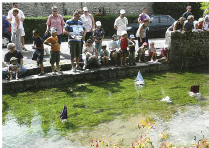
Centre de loisirs : on pourra peut-être jouer aux petits bateaux.

Le centre de loisirs est désormais géré par la communauté de communes. Il continue cependant d'accueillir les enfants à Suèvres avec des activités ludiques,