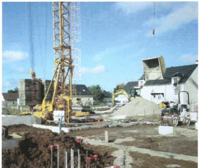
BMGO, Bâtiment Maçonnerie Gros Œuvre , terrassement, construction de programmes de logements, rénovation, plâtrerie, enduit, carrelage. PME artisanale. Jusqu'à 10 salariés. Zone artisanale Les Places 02.54.42.59.66, 06.66.69.63.77. Mail : bmgo.loiret@gmail.com