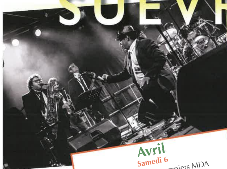
Big Yaz Explosion : c'est du lourd !