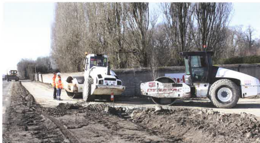
Travaux de la future piste cyclable entre Mer et La Grenouillère.