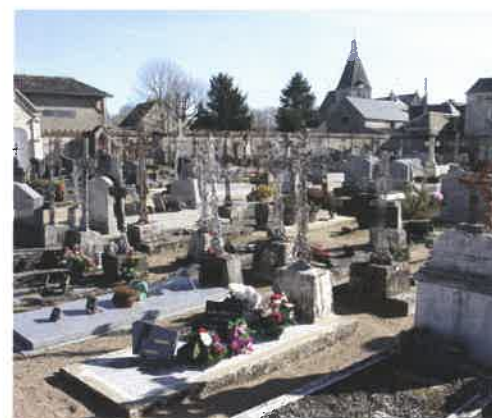
Le cimetière de la Prasle : une gestion compliquée.