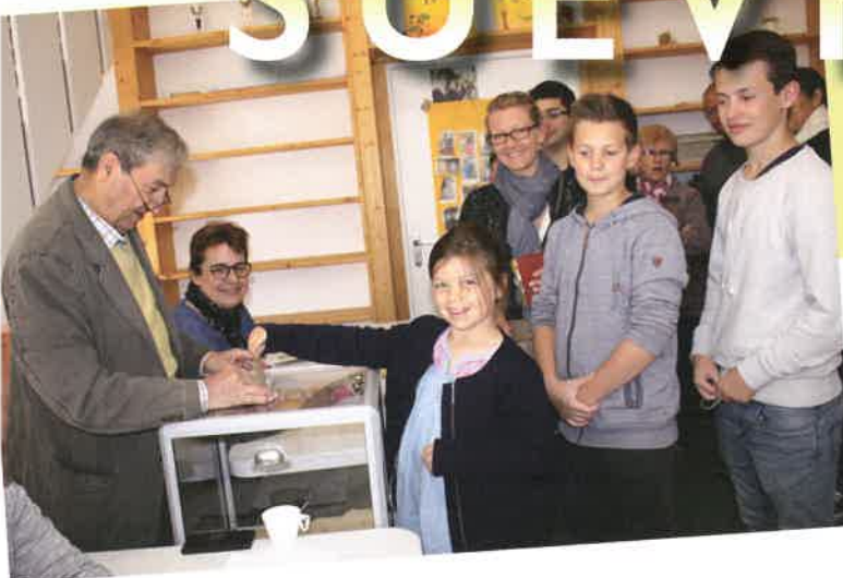
Élections à Suèvres en 2017.