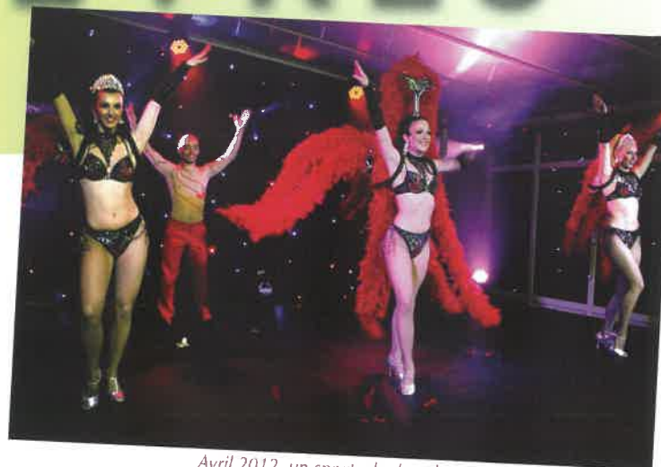
Avril 2012, un spectacle de cabaret parisien