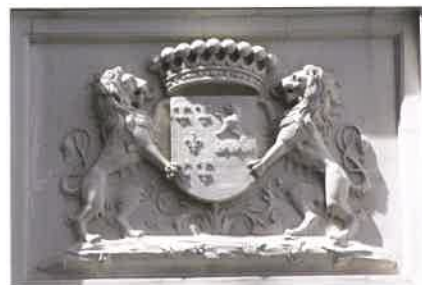
Armoiries des familles Le Normant et Montpinson.

Cette famille aisée et commerçante de Blois achète le château en 1835. On suppose que c'est elle qui a donné au château son allure actuelle. Sur la grille d'entrée, les initiales NG sont bien visibles ainsi que les armoiries sculptées dans la pierre, en façade de l'ancienne chapelle. Sous le Second Empire, Lionel Le Normant est un homme politique, libéral éclairé, fondateur en 1867 de la Société d'agriculture de France.