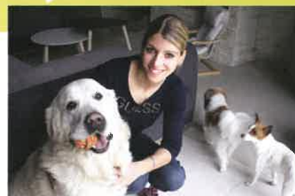
Une pension pour chiens et chats