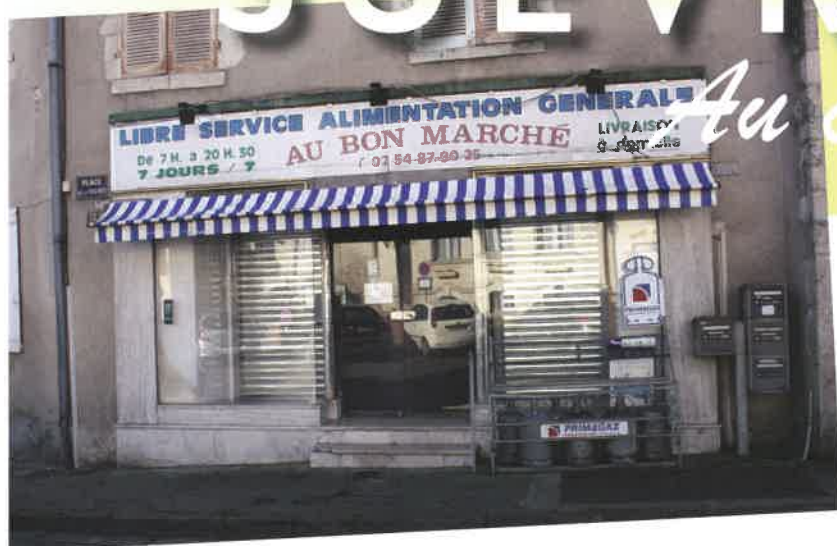
L'épicerie bientôt réhabilitée.

Résumé sélectif des trois derniers conseils. Les comptes rendus complets sont disponibles en mairie.