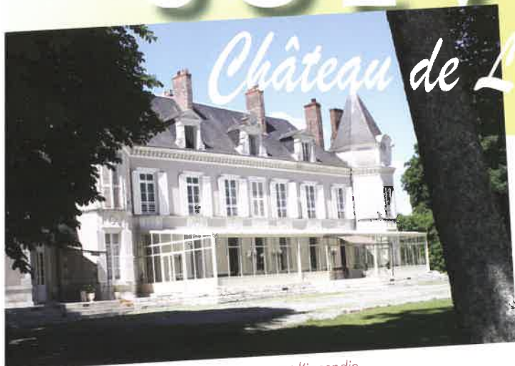
Le château de Laloin avant l'incendie