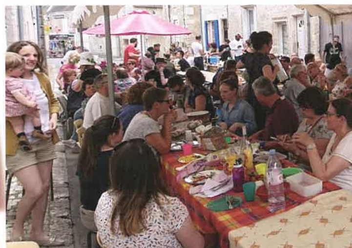
Pique-nique dans la rue, 3 juin 2018.