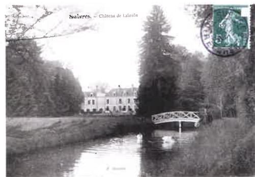
Le château, son parc et son canal en 1908.

Au cours de la guerre de 1870, le château est occupé quelques jours par le prince Frédéric de Prusse, dit le Prince Rouge.