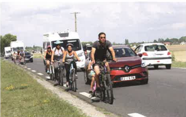
La RD 2152, très dangereuse pour les cyclistes.

un animal (abolements...). La démarche amiable auprès des voisins est toujours conseillée avant d'arriver à un signalement à la mairie ou à la gendarmerie. Une plainte est toujours possible. Il faut alors démontrer la réalité du préjudice et réunir un maximum de preuves : courriers échangés, témoignages, pétition, constat d'huissier, procès-verbal.