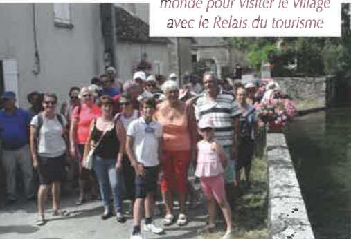
Mardi 16 juillet : beaucoup de monde pour visiter le village avec le Relais du tourisme