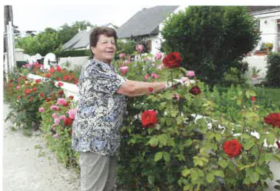
Remarquable jardin de Renée Bordeau, avec ses alstroemerias, ses pavots, ses vendangeuses, ses daturas. Il déborde sur la rue de Montcellereux avec des rosiers multicolores.