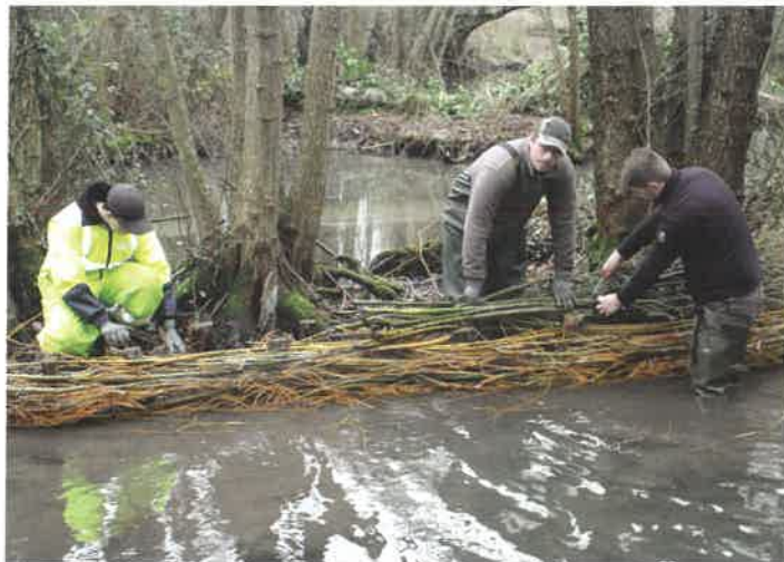
Tressage de saule dans la rivière de la Tronne pour faire barrage.