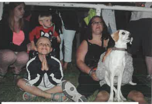
Mercredi 14 juillet, un temps superbe. Des enfants et un chien aux anges pour le feu d'artifice !