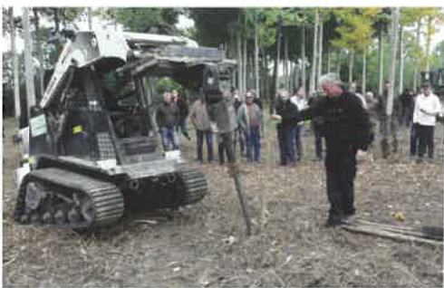
Plantation d'une bouture de peuplier à l'aide d'une tarière.

donc qui travaillent depuis 60 ans à la culture traditionnelle du peuplier dans le val. Chaque année elle commercialise des milliers de plants de « populus canadensis » connus pour leur vitesse de croissance et recherchés pour un usage industriel (contreplaqué, cagettes, palettes). Les plants sont issus de boutures de 20 cm qui atteignent 4 à 6 mètres en deux ans. Ils sont vendus sous forme de « plançon », c'est à dire de tiges coupées au ras du sol, sans racines et sans branches, destinées à prendre racine facilement. Cette technique, surprenante mais efficace, a remplacé celle de plants à racines nues pratiquée autrefois.