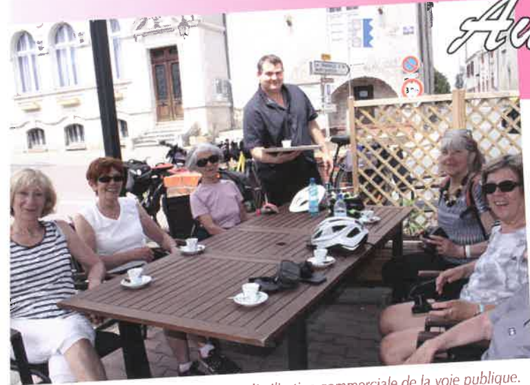
Un arrangement est en cours pour l'utilisation commerciale de la voie publique.