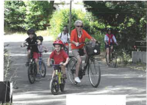
Un tourisme familial à vélo tout l'été.