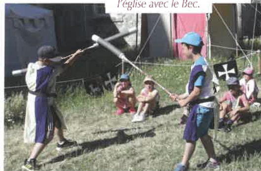
Jusqu'à la fin juillet, camp médiéval derrière l'église avec le Bec.