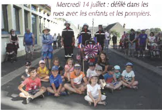
Mercredi 14 juillet : défilé dans les rues avec les enfants et les pompiers.