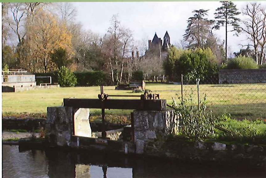
Le bief et le déversoir du moulin de Rochechouard. Au fond, le château des Forges et l'église Saint-Lubin.

Peu de communes peuvent s'enorgueillir d'autant de qualités. Encore préservée de l'urbanisation, pleine de charme et de surprises, Suèvres compte de très nombreux atouts qui en font un des villages les plus séduisants de nos bords de Loire.