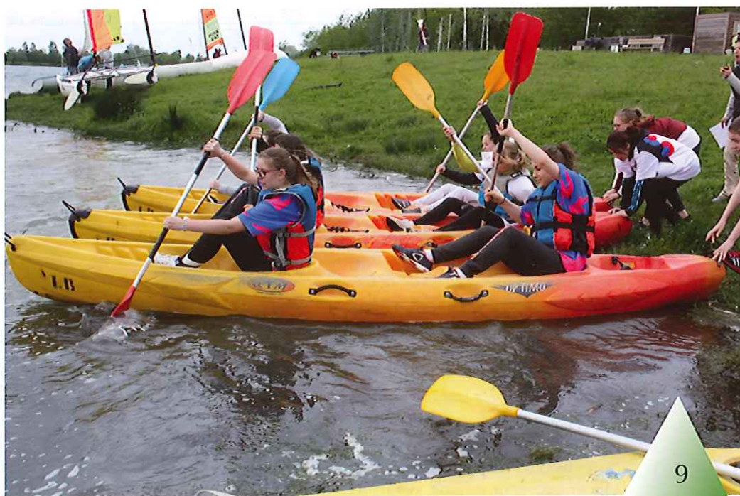
Raid des lycées de l'UNSS au Domino, mai. 2016.

Suèvres, commune d'accueil ? Oui, à condition de jouer ses atouts : les hébergements de proximité, les activités douces, la Loire à vélo, l'accueil des pèlerins de Saint-Jacques, les visites de village, la traversée de la Loire par le bac, etc. C'est tout l'enjeu de la maîtrise du développement du village : ni village musée, ni village dortoir. ■