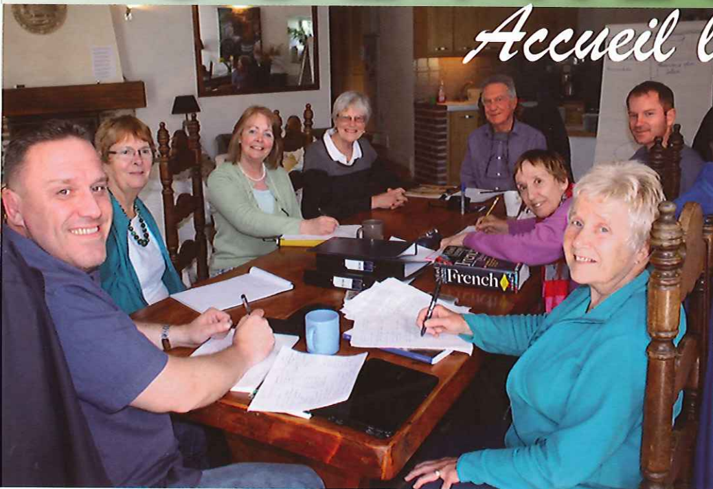
Les Anglais au moulin de Gastines en mai dernier : séance de travail avec les animateurs.