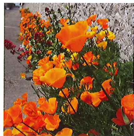
Escholtzia au pied des murs à Fleury.

core, définir et adapter les types de végétaux, planter des arbustes et des rosiers avec des vivaces ou des bulbes, réfléchir aux grimpantes sur les allées piétonnes, le long de la Tronne, au centre bourg où il y a peu d'espace végétalisé. Il faudra y penser quand on