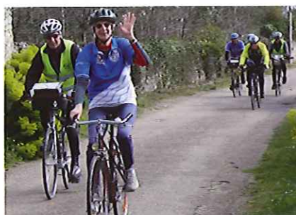
Sur les routes du coteau.

La journée s'adresse à tous, y compris aux enfants. Elle est conçue comme