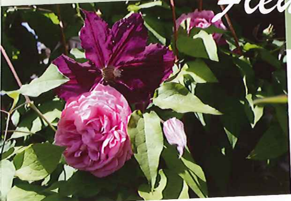
Mariage idéal entre clématite et rose ancienne.