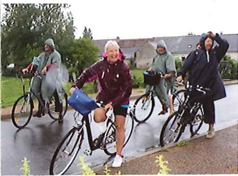
L'édition 2015 : la pluie n'a pas gêné les amateurs.

une activité de détente avec la découverte d'un patrimoine modeste ou méconnu comme les lavoirs, le déversoir, les levées, les anciens ports ligériens, les fontaines. Certaines animations pourront être mises en place sur les parcours par des associations partenaires. ■