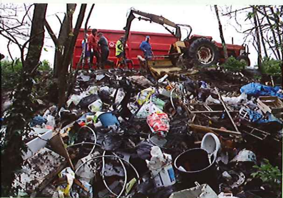
La décharge sauvage chemin de Montcellereux

Au cours de la séance, il est évoqué l'opération pédagogique du vendredi 22 avril destinée à rappeler les devoirs civiques de chacun et le respect de l'environnement. Le maire, plusieurs conseillers et les agents municipaux se sont retrouvés chemin de Montcellereux pour nettoyer une décharge sauvage bien connue de tous. Une benne, un engin de levage et un camion ont été nécessaires. L'entreprise, beaucoup plus importante que prévu, n'est d'ailleurs pas finie, une deuxième journée est envisagée ! Depuis des années, des gens peu scrupuleux ont déversé ici toute sorte d'objets : vieux frigos, télévisions cassées, canapés crevés, bacs en plastique, cuvettes de toilette, gra-