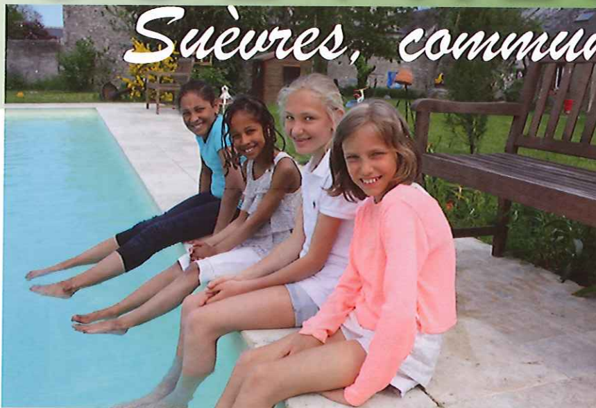
Au Bonheur-des-hôtes, ces petites touristes trouvaient l'eau encore un peu fraîche au mois de mai.