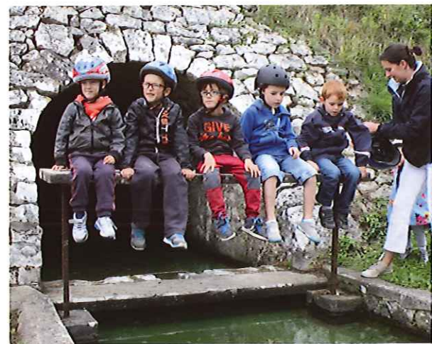
Les petits cyclistes sur la planche du lavoir du Mousseau à Cour-sur-Loire.