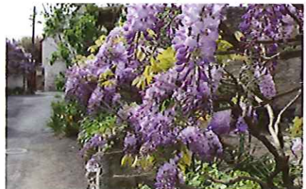
Glycine rue Saint-Martin

refera la voirie : décaisser certains bas de murs, ajouter de la terre, planter de petits massifs, mettre du paillage. Il y a des plantes qui ne coûtent pas cher. On pourrait monter un club, organiser des échanges gratuits, faire avancer les choses entre voisins. Je peux donner des conseils » propose-t-il. Alors pourquoi ne pas tenter l'expérience, se réunir au mois de septembre, inviter les amateurs et tous ceux qui veulent bien se lancer dans cette belle aventure ? ■