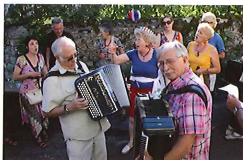
Le 13 juillet, fête des voisins au quartier Saint-Martin.

Dimanche 28 août Les Échappées à vélo, 2 ème édition