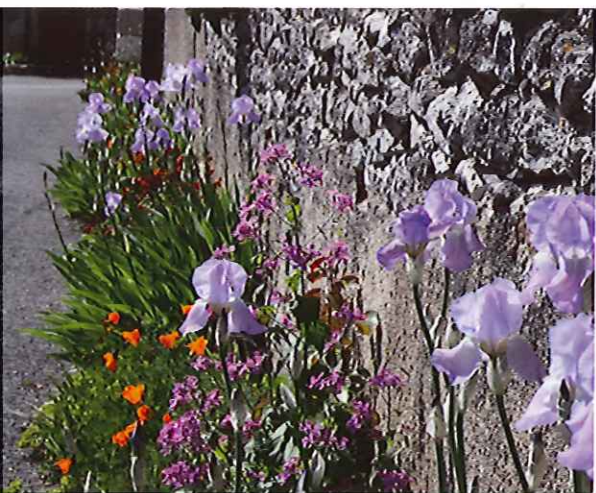
Iris, monnaie du pape et giroflée à Saint-Martin.

Depuis deux ans, la municipalité propose de petites enveloppes de jachère fleurie et des échanges de plantes lors du marché d'avril, mais il reste un réel potentiel de développement en matière de fleurissement. Certains quartiers ont pris en main leur environnement. Pour le quartier Saint-Martin, le résultat est remarquable. Le fleurissement des pieds de murs à Fleury a fait des émules. La rue des Moulins peut se flatter du magnifique jardin du Moulin-Pont. Dans la rue des Juifs, pourtant