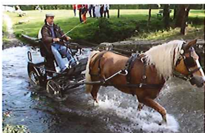
Traversée du gué des Grands-Moulins en calèche.