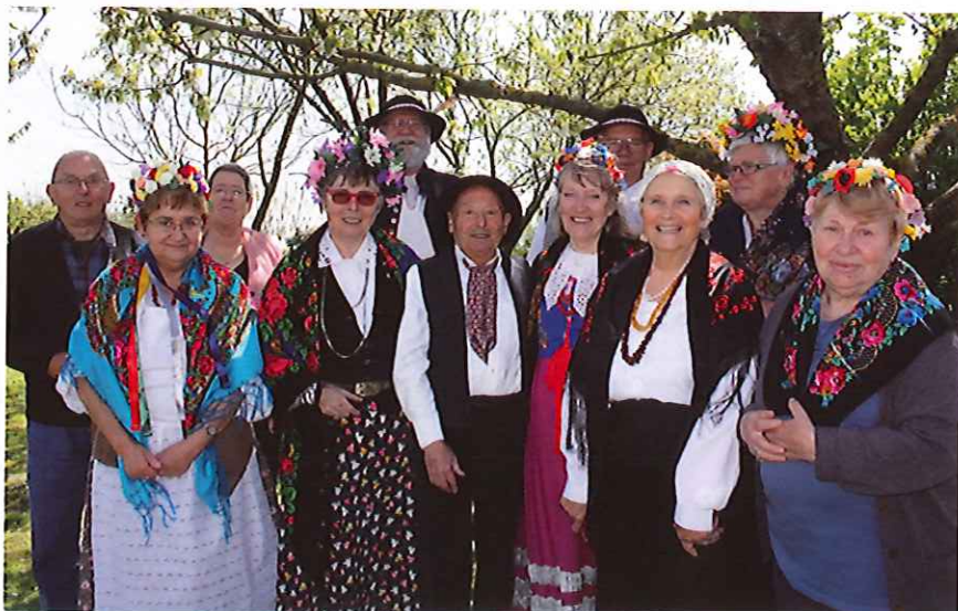
Costumes folkloriques et festivités à Balâtre avec les responsables de Val-de-Loire-Pologne.

Les jeunes lauréats du concours sont récompensés par une quinzaine de jours en France où ils découvrent le patrimoine culturel, gastronomique et historique, l'occasion aussi de pratiquer la langue avec leurs familles d'accueil. Une réception est organisée chaque année en leur honneur à la mairie de Suèvres et de Blois. ■