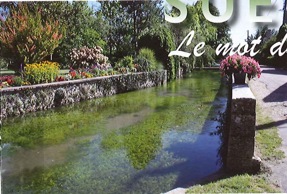
La rivière de la Tronne, rue des Moulins, un petit paradis