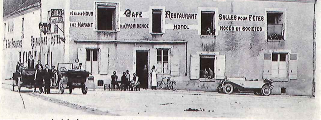
La Providence en 1931 : « Où allons-nous ? Chez Marant ».